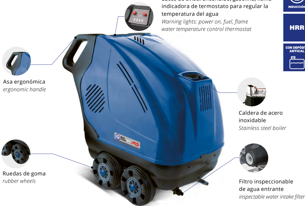
Asa ergonómica ergonomic handle