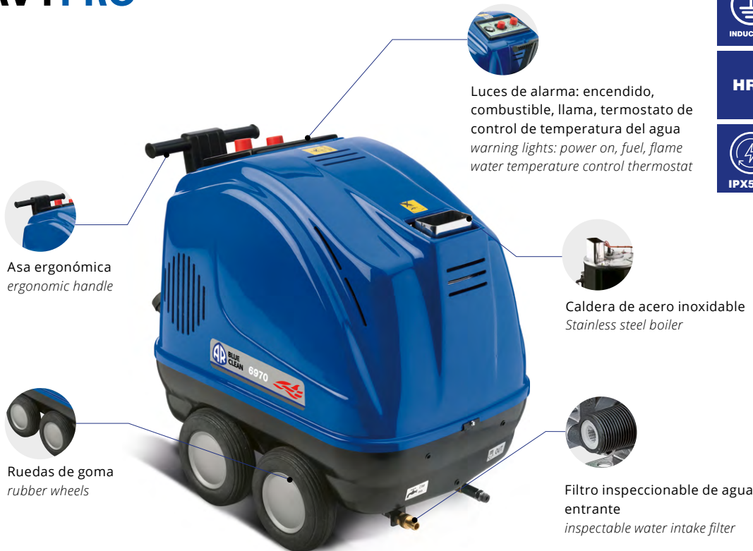
Asa ergonómica ergonomic handle